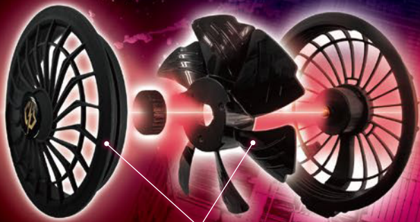
The blades can be removed and washed in water.